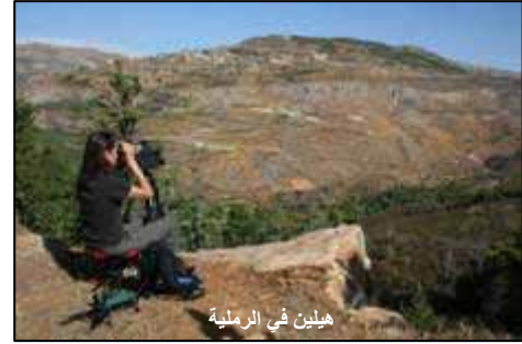
هيلين في الرملية

في سنة 2005 كان هناك 4 مناطق هامة للطيور فقط في لبنان. هذه السنة ارتفع العدد الى 11 منطقة. تتواجد العشر مناطق الجديدة والتي درست من بين 31 موقع في اماكن مختلفة من لبنان وتتضمن الاراضي الرطبة، الغابات، الجبال